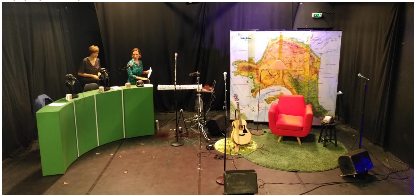
PHOTO DU PLATEAU

Cette restriction ne vaut pas pour le public et les captations amateurs de type smartphone.