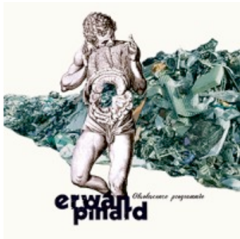
Obsolence programmée, 2016