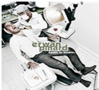
Sauver les meubles, 2012